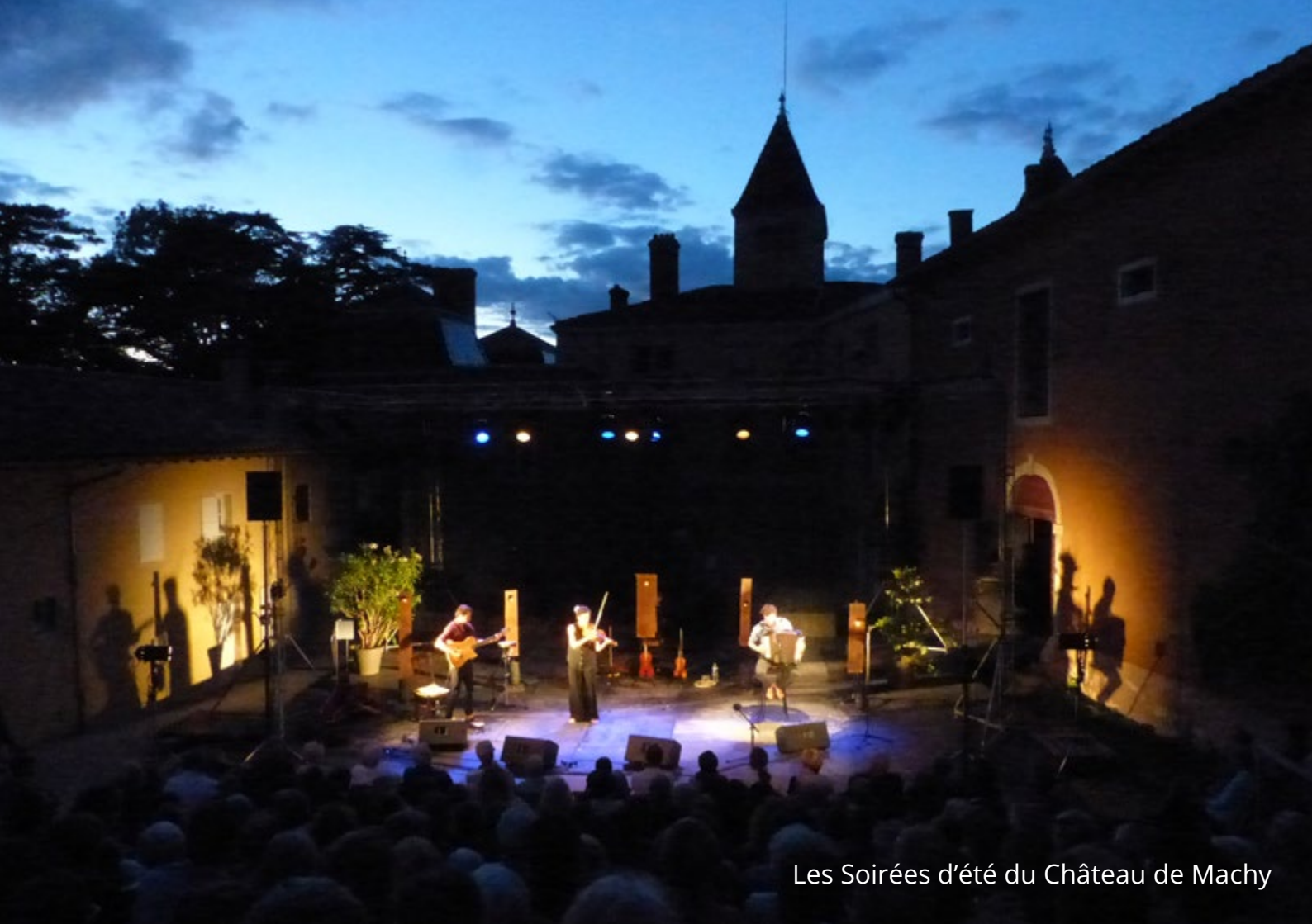
Les Soirées d'été du Château de Machy